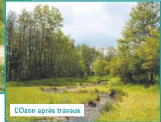
L'Ozon après travaux